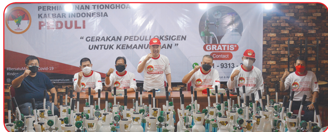
Para pengurus PTK Indonesia memberikan semangat untuk saling berbagi di tengah pandemi.

menjalani isolasi mandiri (isoman) di rumah atau yang berada di rumah sakit karena terpapar Covid-19.