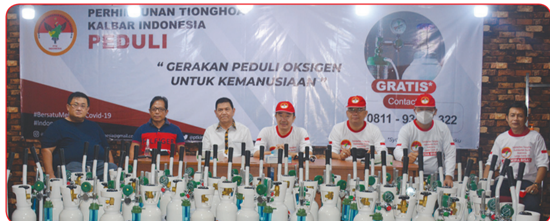
Para pengurus PTK Indonesia berfoto bersama.