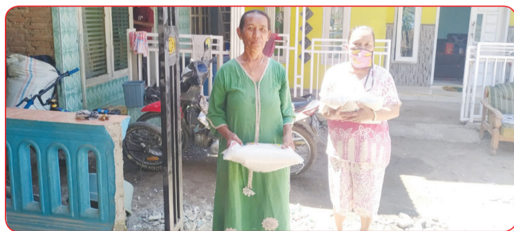
Baksos PT Indah Sinar Perkasa, PT Sinar Indahjaya Kencana, dan Grand Elephant dengan membagikan beras untuk warga terdampak pandemi.