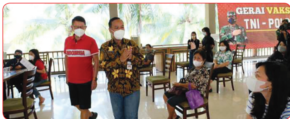
Wali Kota Magelang Muchamad Nur Aziz menghadiri vaksinasi yang diselenggarakan PSMTI Kota Magelang di Hotel Puri Asri.

MAGELANG (IM) - Pemerintah Kota Magelang mengapresiasi sejumlah pihak yang menggelar vaksinasi Covid-19 bagi masyarakat.