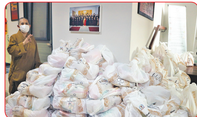
Bantuan paket sembako.