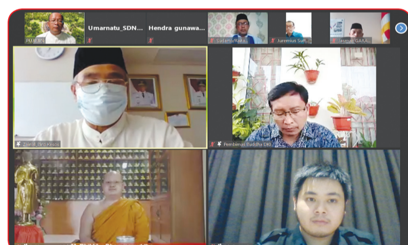
Penyampaian sambutan kegiatan puja bakti.

Acara yang berlangsung secara virtual melalui zoom meeting tersebut diinisiasi langsung oleh Gubernur DKI Jakarta Anies Baswedan dan Wakil Gubernur Ahmad Riza Patria yang mengharapkan diselenggarakannya kajian keagamaan bagi seluruh pegawai